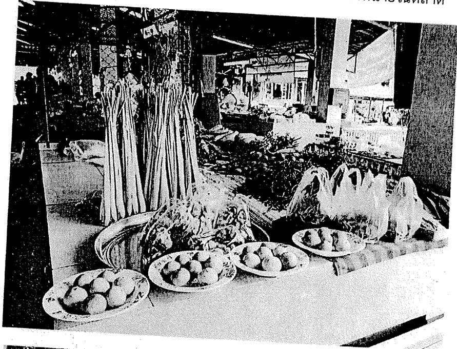
ส่งเสริมสนับสนุนให้ผู้ค้านำพืชผักปลอดสารพิษมาจำหน่ายในตลาด